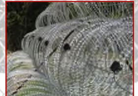
仮設の有刺鉄線にも