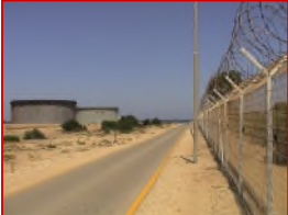
防爆エリア対応可能