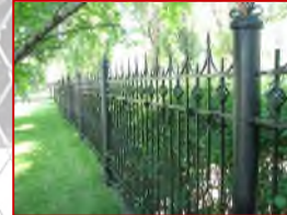
装飾フェンスにも