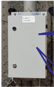
ペリメーター・コントロール・ユニット EF-2000RS