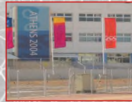
アテネ五輪選手村