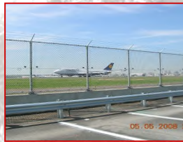
ジョン・F・ケネディ空港