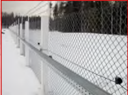
極寒のシベリアでも