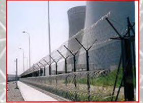
チェコ原子力発電所