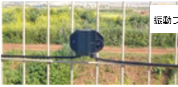
振動フェンスセンサー Viper